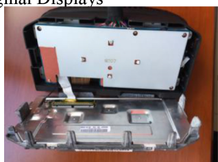
17. Verbinden Sie den Stecker des Displays mit Aluminium Abdeckung