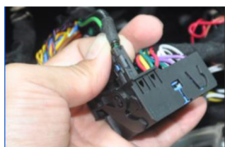
21.Stecken Sie den LWL Kabeladapter an den originalen Stromstecker