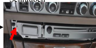
8. Entfernen Sie die Schrauben