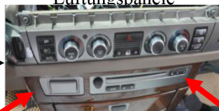
7.Nehmen Sie die untere Abdeckung heraus