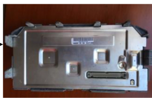
15.Original Bordcomputer und Abdeckungsdarstellung