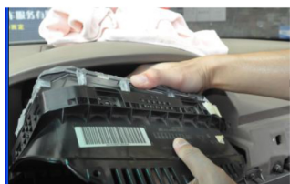
13.Entfernen Sie hinten die Aluminium Abdeckung des original Displays