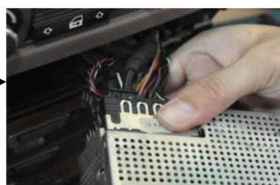
22. Schließen Sie den Stromstecker an