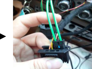
20. Verbinden Sie die LWL Kabel an unseren Adapter