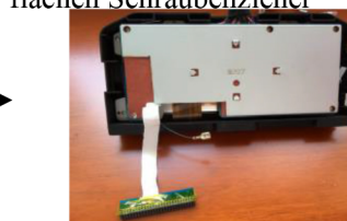
16.Nehmen Sie nun das Nachrüst Display.