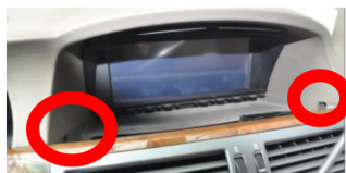
5.Entfernen Sie die beiden Schrauben und dann die Abdeckung