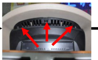
10.Entfernen Sie die Schrauben vom original Monitor