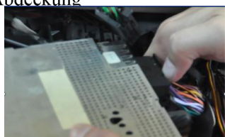
9.Nun ziehen Sie den Stromstecker raus