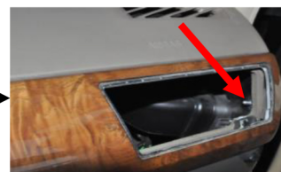
4.Entfernen Sie die Schrauben