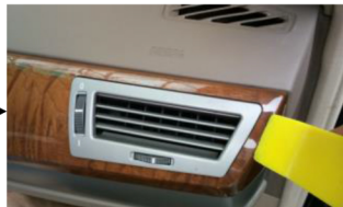
3. Entfernen Sie die Lüftungspanele