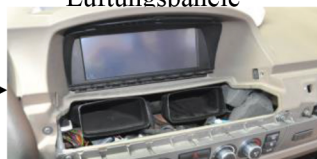
6.Entfernen Sie die Lüftungen