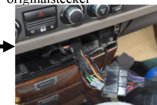
23.Verbinden Sie die Stromkabel miteinander