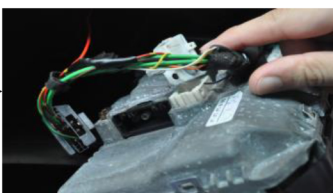
11.Entfernen Sie den Monitor Stecker