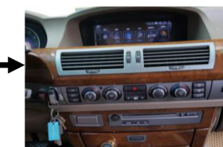
24. Montieren Sie alle Abdeckungen