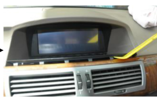
2. Entfernen Sie die Lüftungspanele