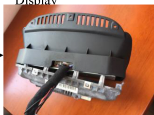
18. Montieren Sie die Aluminium Abdeckung an das neue Display