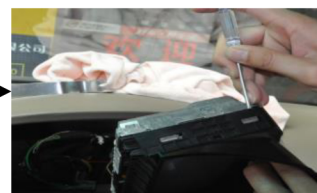
12.Entfernen Sie die Plastikabdeckung mit einem flachen Schraubenzieher